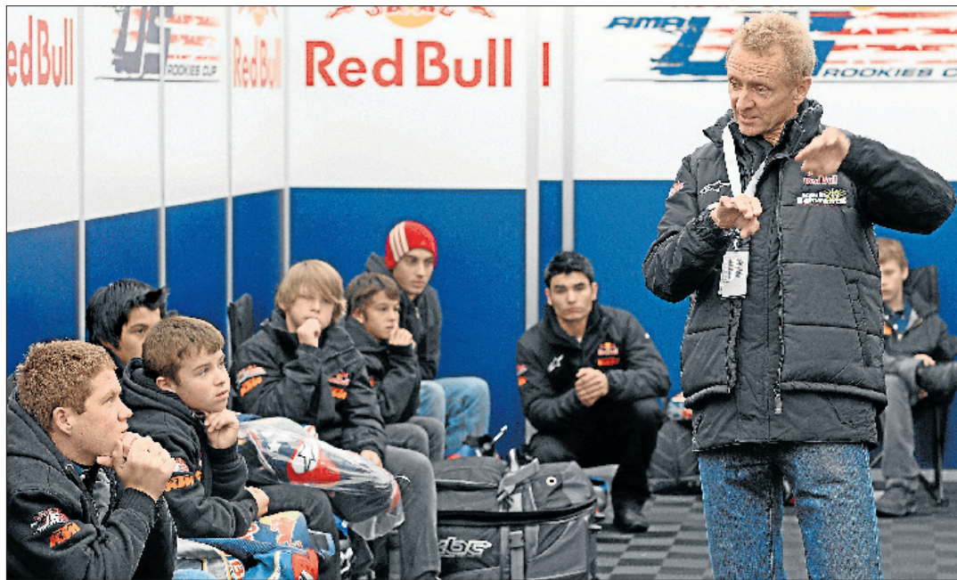
PROFESOR. Kevin Schwantz da clases de pilotaje a los chavales que sueñan con emular a sus ídolos.